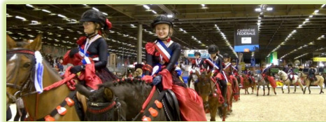
Champion de France des Carrousels