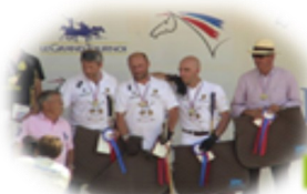
Vice Champion de France polo