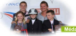
Médaille de bronze CSO shetlands