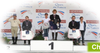
Champion de France CSO Cadet