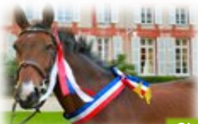
Champion de France CSO Vétéran